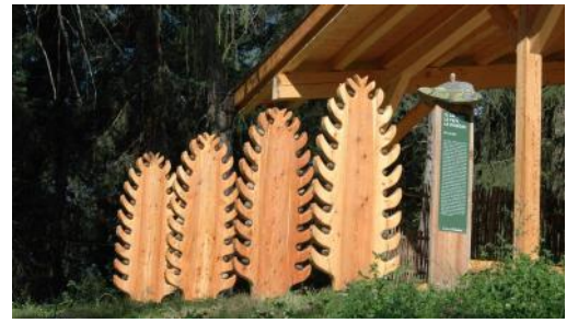
Il lavoro, le fate, le streghe