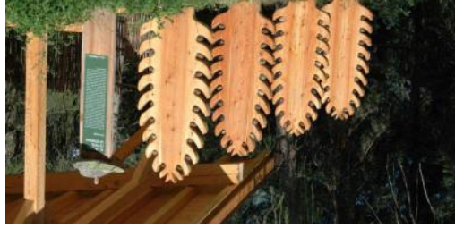
TOP Il lavoro, le fate, le streghe