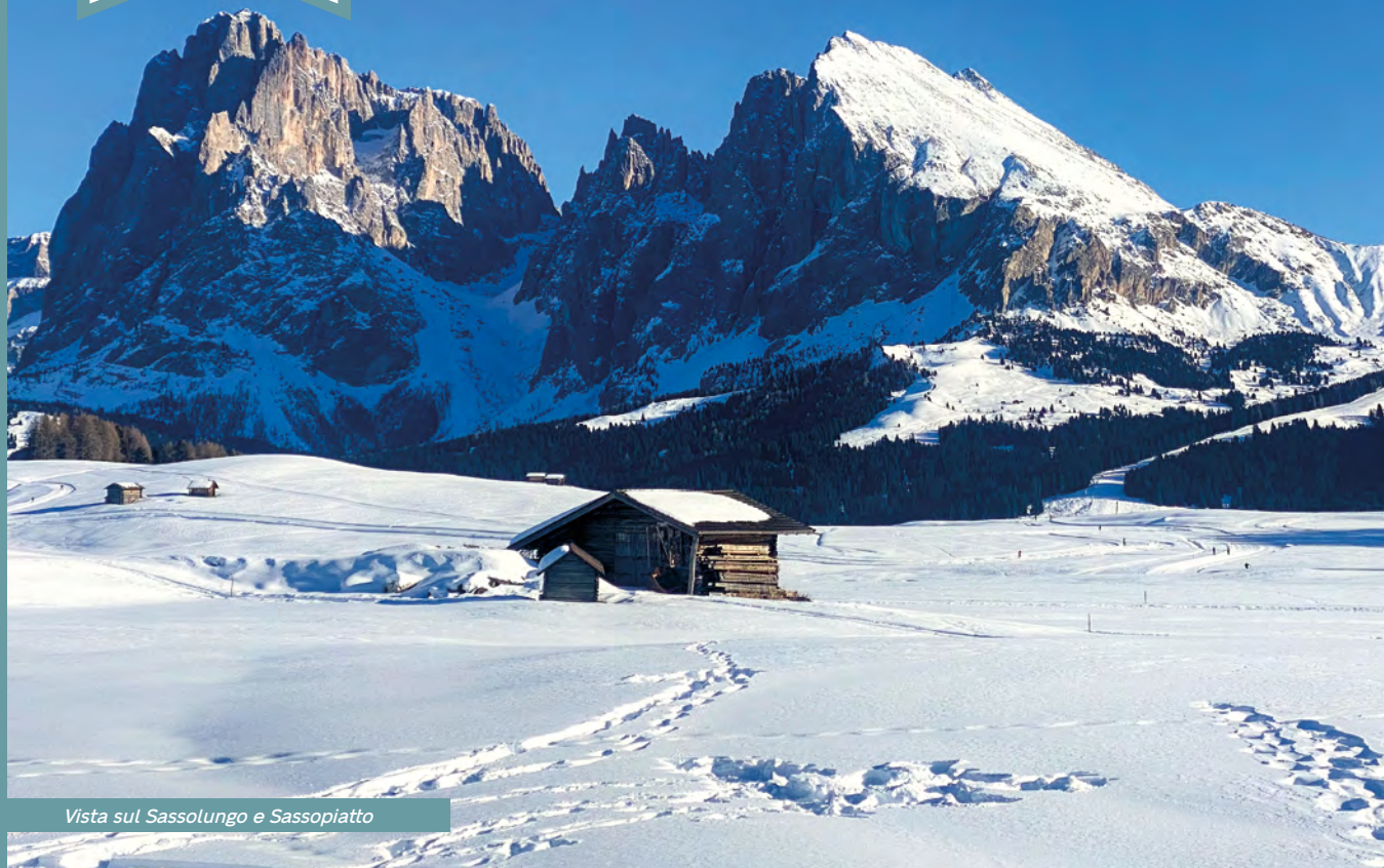
Vista sul Sassolungo e Sassopiatto