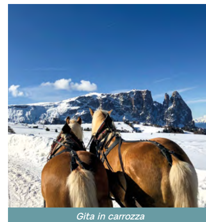
Gita in carrozza