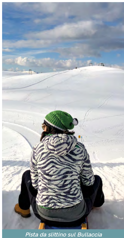
Pista da slittino sul Bullaccia