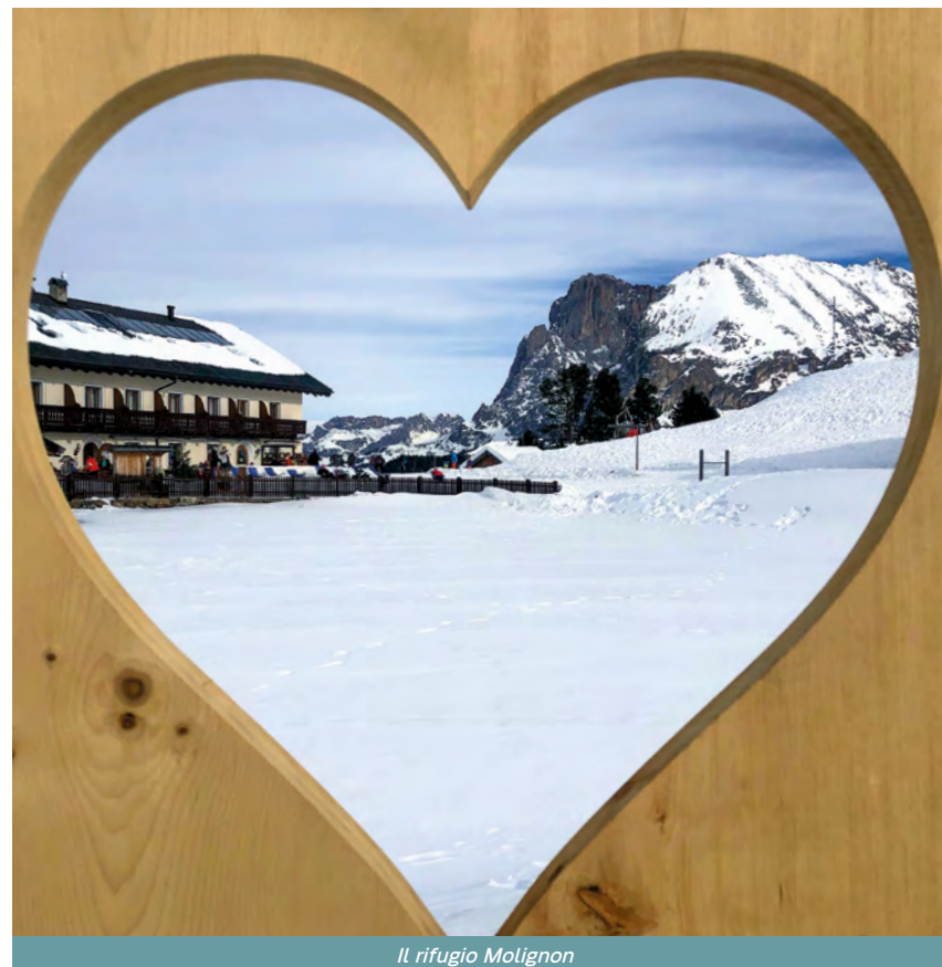
Il rifugio Molignon